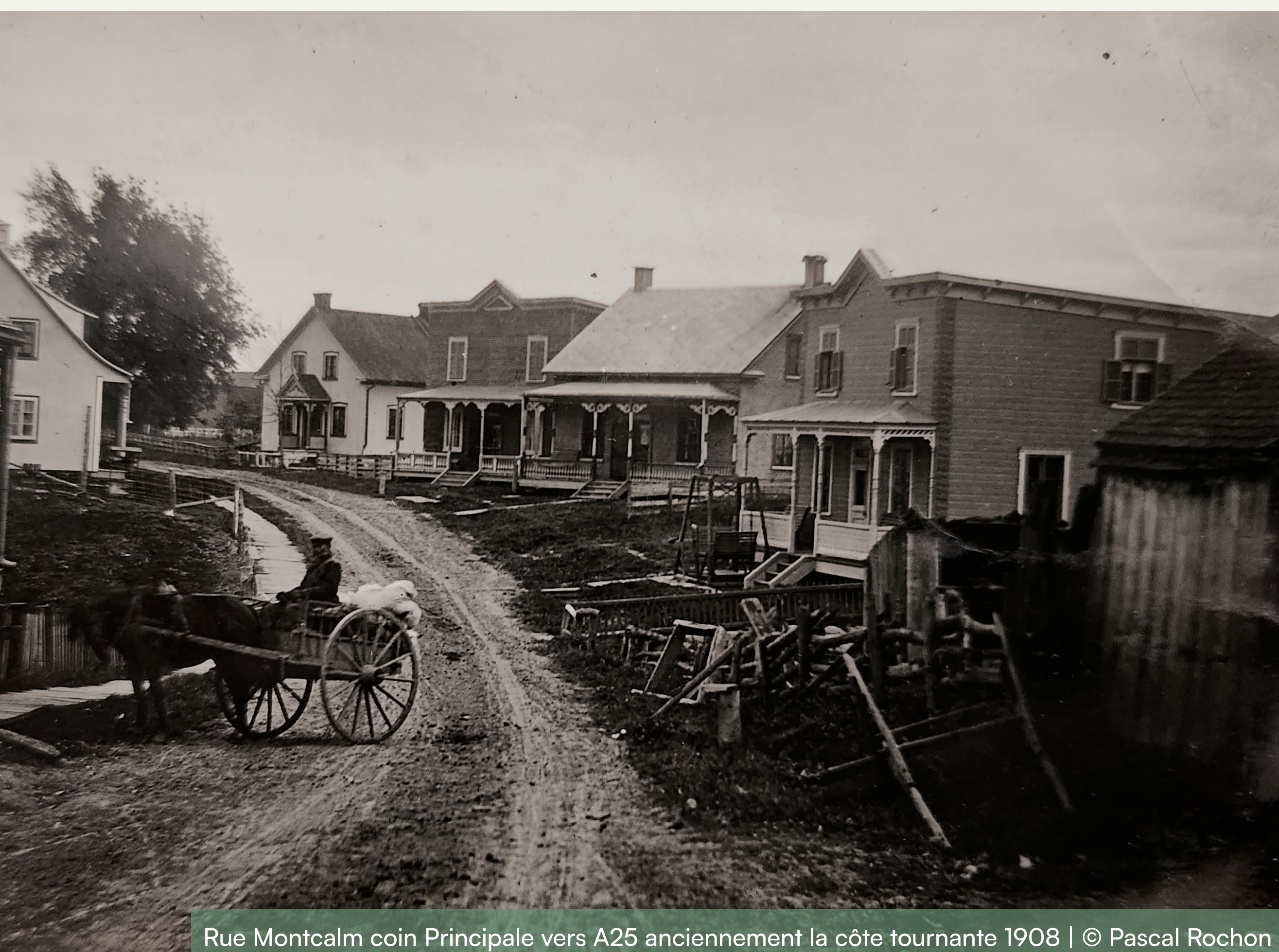
Rue Montcalm coin Principale vers A25 anciennement la côte tournante 1908

Voici quelques photos historiques du village, démontrant les différents points de vue de l'époque, à partir de cet emplacement précisément. Il est intéressant de mentionner que la rue Saint-Louis était un tronçon de la route provinciale 18 (par la suite 125) et représentait le seul accès pour se rendre à Montréal. La route 18 permettait de relier Saint-Donat et Montréal. La rue Principale, entre la rue Montcalm et la 3 e Avenue, n'existait tout simplement pas. L'intersection Principale/Montcalm était en « T » et on y trouvait une jolie maison québécoise blanche. Les gens circulant vers Montréal devaient donc obligatoirement bifurquer vers la rue Saint-Louis.