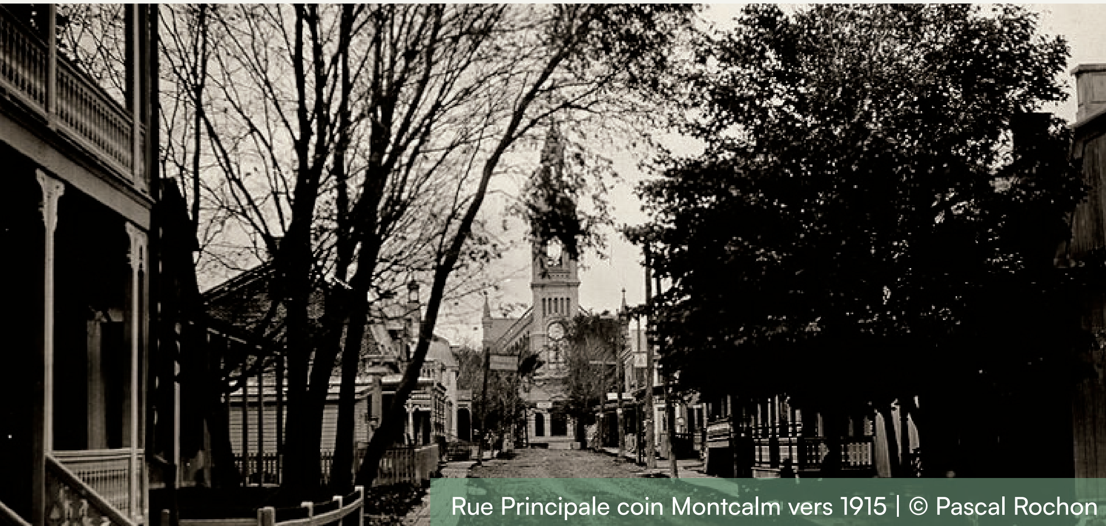
Rue Principale coin Montcalm vers 1915

Voici quelques photos historiques du village, démontrant les différents points de vue de l'époque, à partir de cet emplacement précisément. Il est intéressant de mentionner que la rue Saint-Louis était un tronçon de la route provinciale 18 (par la suite 125) et représentait le seul accès pour se rendre à Montréal. La route 18 permettait de relier Saint-Donat et Montréal. La rue Principale, entre la rue Montcalm et la 3 e Avenue, n'existait tout simplement pas. L'intersection Principale/Montcalm était en « T » et on y trouvait une jolie maison québécoise blanche. Les gens circulant vers Montréal devaient donc obligatoirement bifurquer vers la rue Saint-Louis.