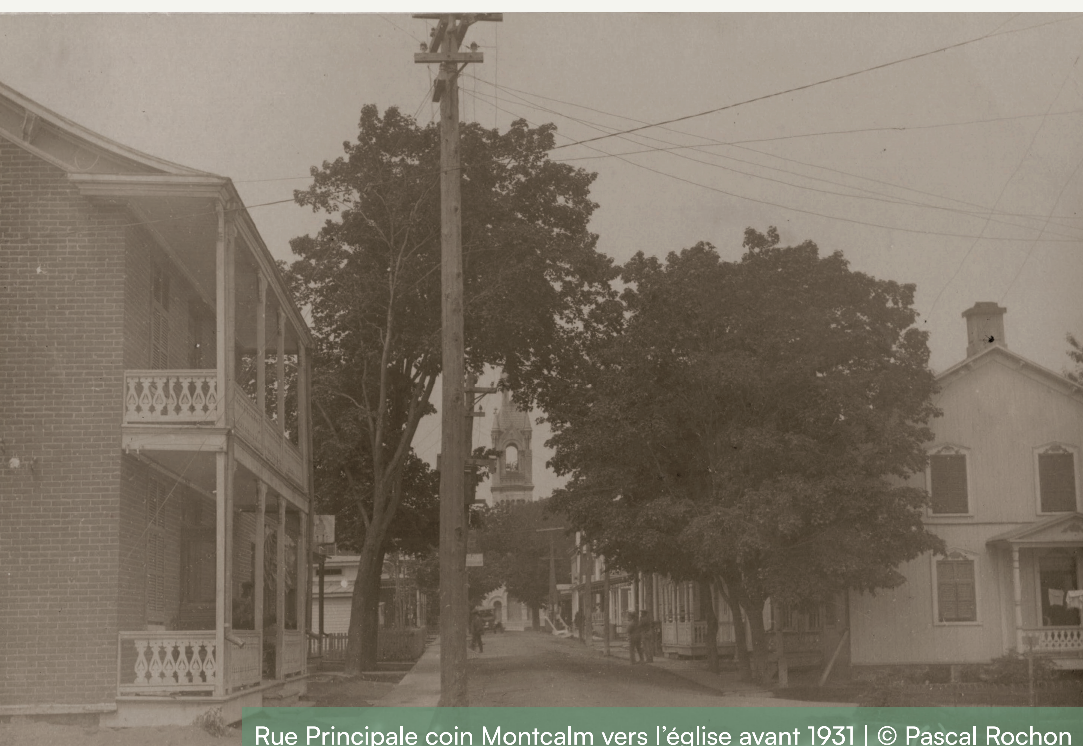
Rue Principale coin Montcalm vers l'église avant 1931