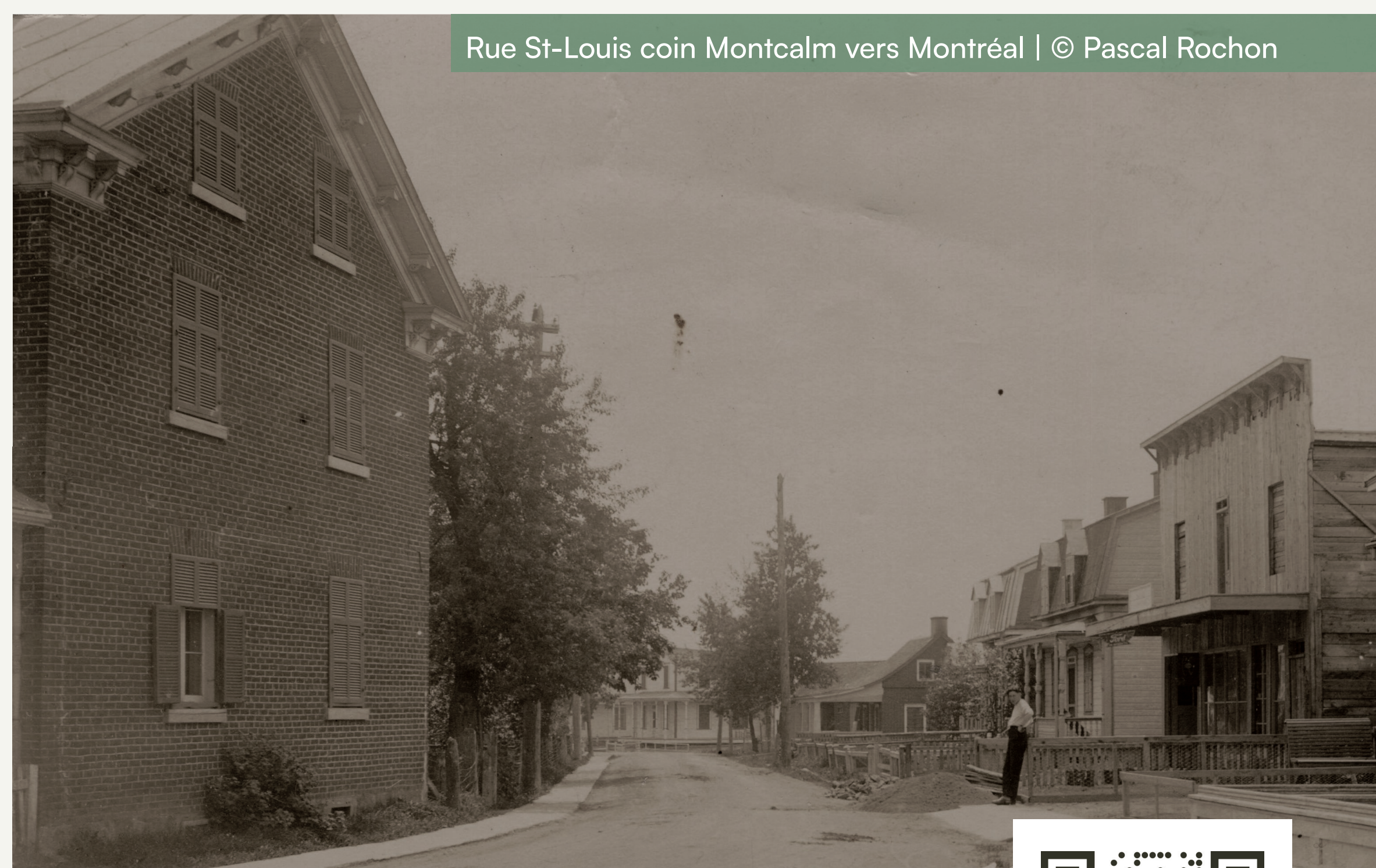
Rue St-Louis coin Montcalm vers Montréal