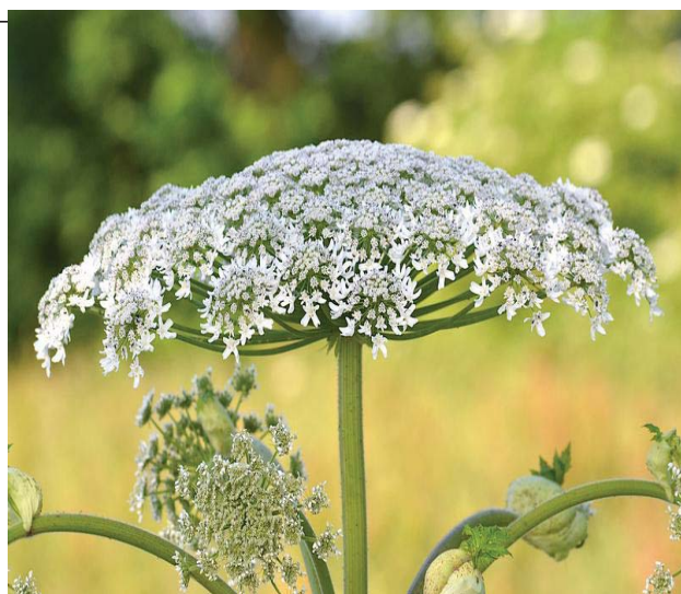
Berce du Caucase